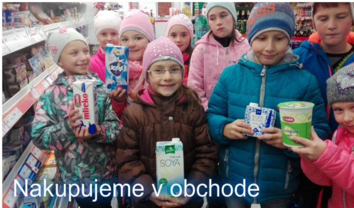
Nakupujemo v obchode