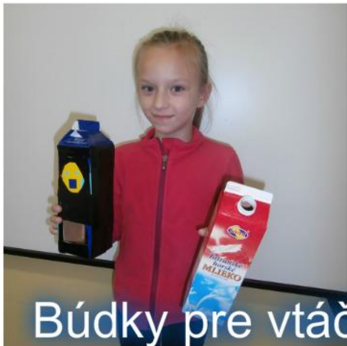
Búdky pre vtáčikov