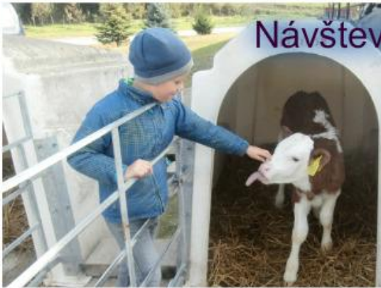
Návšteva Roľníckeho družstva v obci